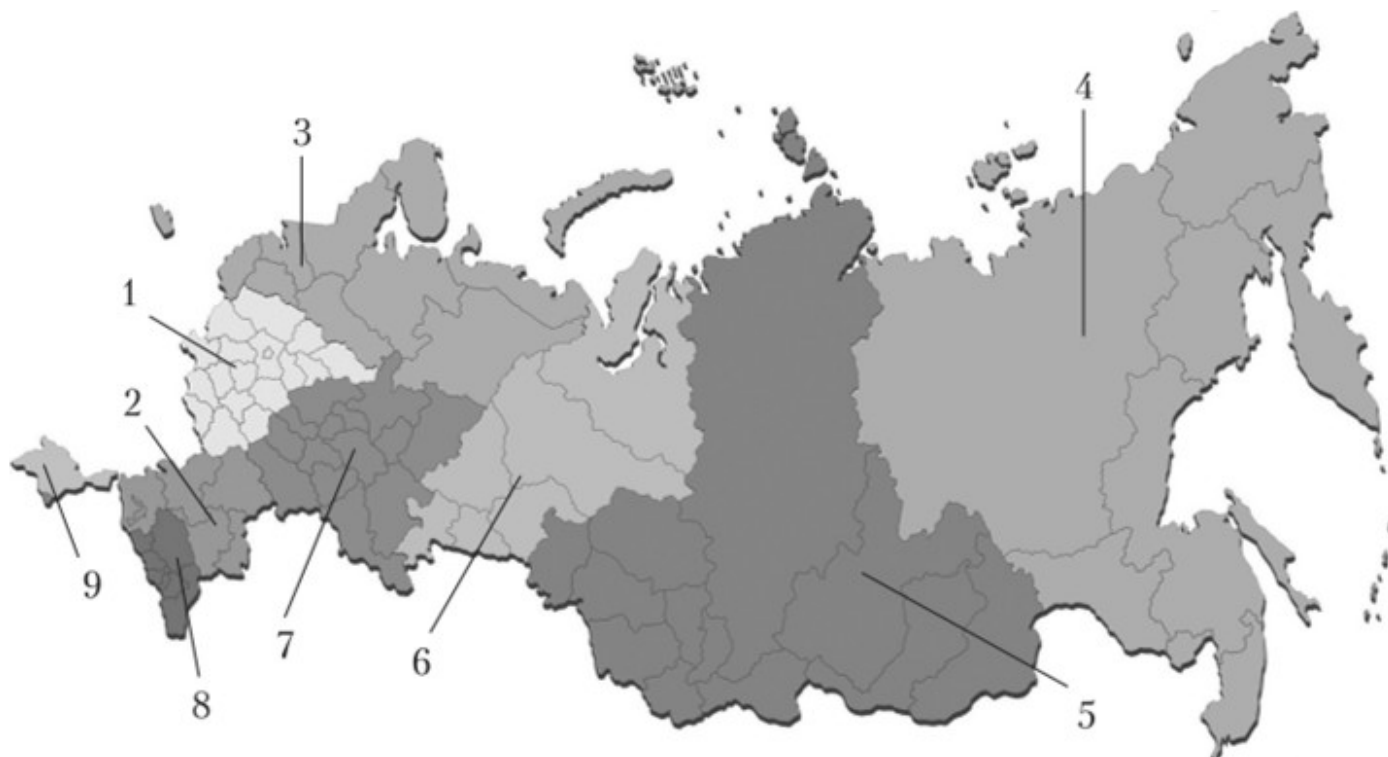
Рис. Федеральные округа Российской Федерации:

1 — Центральный федеральный округ (ЦФО); 2 — Южный федеральный округ (ЮФО); 3 — Северо-Западный федеральный округ (СЗФО); 4 — Дальневосточный федеральный округ (ДФО); 5 — Сибирский федеральный округ (СФО); 6 — Уральский федеральный округ (УФО); 7 — Приволжский федеральный округ (ПФО); 8 — Северо-Кавказский федеральный округ (СКФО); 9 — Крымский федеральный округ (КФО)